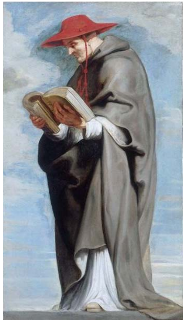
Hl. Bonaventura – Ölbild von Peter Paul Rubens aus dem Jahr 1620, Original im Palais des Beaux-Arts de Lille