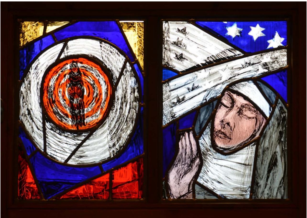
Glasfenster „Hildegard von Bingen“ in der Kapelle des Maierhofes im Kloster Benediktbeuern

Meistens wird Hildegard mit Äbtissinnenstab, Modell des Klosters Rupertsberg bei Bingen und Buch dargestellt. Diese drei Attribute stehen stellvertretend für ihr Lebenswerk. Die aus adligem Haus stammende Frau gründete um das Jahr 1150 ein Benediktinerinnenkloster auf dem Rupertsberg bei Bingen, dem sie als Äbtissin vorstand, ebenso wie dem später gegründeten Kloster in Eibingen auf der anderen Rheinseite. Das Buch weist auf ihre herausragende Bedeutung als Universalgelehrte, die uns ein beachtliches Werk hinterlassen hat. Noch heute liegen ihre Bücher über Kräuterheilkunde auf den Büchertischen. Weniger bekannt sind ihre Schriften, in denen sie über ihre eigenen geistlichen Erfahrungen berichtet. Sie fasst dabei ihre göttlichen Offenbarungen in sprachgewaltige Bilder. Das bedeutendste Werk trägt den Titel „Liber scivias“ (übersetzt mit: „Wisse die Wege“) und enthält 13 Visionen, die Hildegard eine außerordentliche Stellung in der Spiritualitätsgeschichte verschaffen.