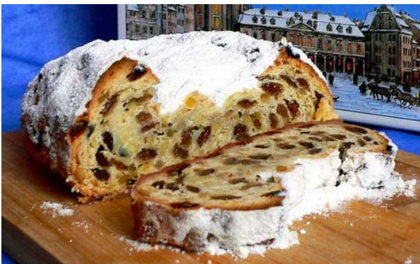
Christstollen – kein Advents-, sondern ein klassisches Weihnachtsgebäck

Zurück zur Fastenzeit, die auf das St.-Martinsfest folgte. Sie fällt nicht nur in heutigen Tagen schwer. Davon zeugen nicht zuletzt die vielen Geschichten, die über einfallsreiche Mönche erzählt werden. Sie haben immer wieder mit raffinierten Tricks versucht, die Fastenregeln zu umgehen. Am bekanntesten dürften die Schwäbischen Maultaschen sein, liebevoll auch "Herrgotts Bscheißerle" genannt. Gewieftete Mönche aus Maulbronn sollen sie erfunden haben, indem sie in der Fastenzeit die Fleischmasse einfach im Nudelteig versteckten. Ähnlich amüsant ist die Legende vom Fastenbier. Klosterbrüder kamen auf die spitzfindige Idee, gewöhnliches Bier vom Papst als Fastenspeise anerkennen zu lassen - getreu der Regel "Flüssiges bricht Fasten nicht". Sie wussten natürlich, dass ihr Bier auf der langen Reise nach Rom verderben und so dem Papst nicht munden würde. Überliefert ist die Antwort des Pontifex: "Wenn sie so etwas trinken wollen, dann sollen sie es haben."