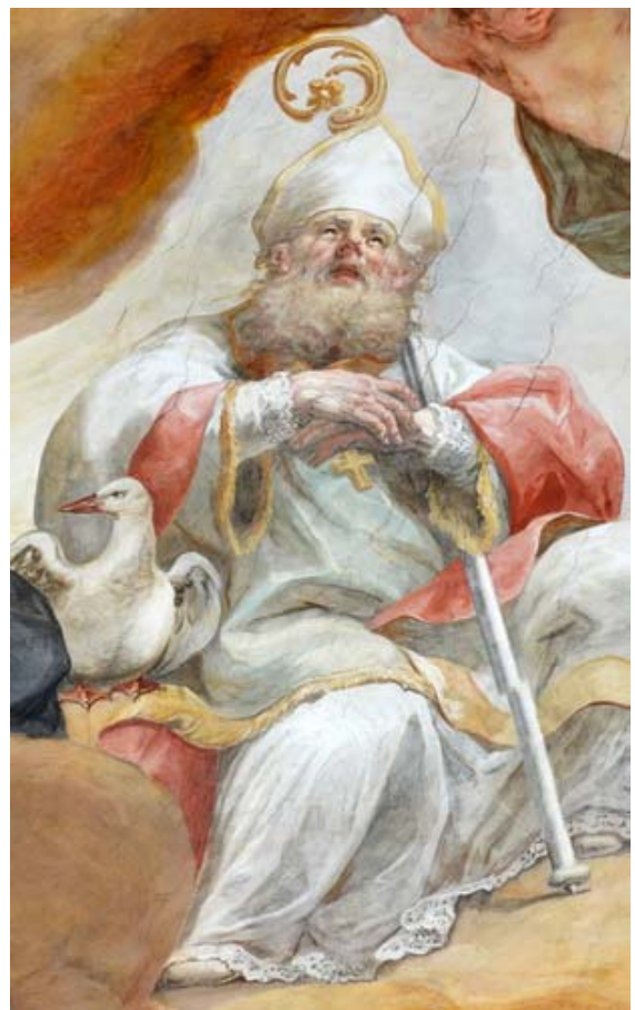
Hl. Martin von Tours mit Gans – Deckenfresko in der Benediktinerabtei Neresheim

Alt ist auch der Brauch, ein großes Feuer zu St. Martin zu entzünden – ein christliches Zeichen, dass das göttliche Licht stärker ist als die Finsternis. Wenn heute die Kinder mit Lampions durch die Stadt ziehen, greifen sie diese Lichtsymbolik auf und geben schon eine Vorschau auf den Heiligen Abend, an dem mit der Geburt Jesu das göttliche Licht in die Welt trat.