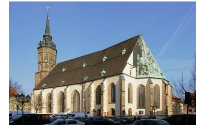
Dom zu Bautzen